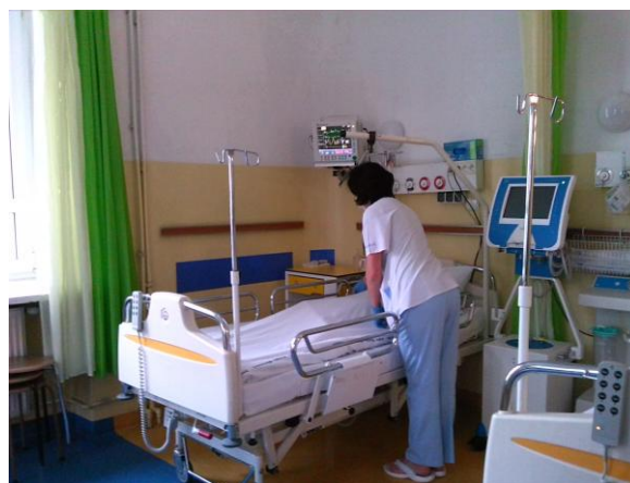
Sala intensywnego nadzoru neurologicznego