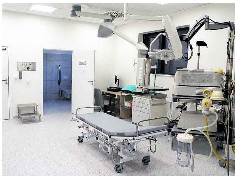
Pracownia endoskopii - gabinet diagnostyczno-zabiegowy