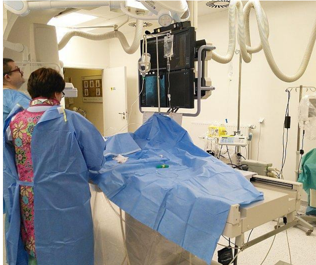
Ośrodek diagnostyki i terapii wewnątrznaczyniowej - pracownia hemodynamiki

Z początkiem lutego w Szpitalu Wolskim ruszył nowy pawilon, w którym znalazły miejsce kardiologia i pracownia endoskopii. Władze szpitala zapowiadają tym samym znaczną poprawę warunków pobytu, diagnozowania i leczenia pacjentów, a także większy komfort pracy lekarzy.