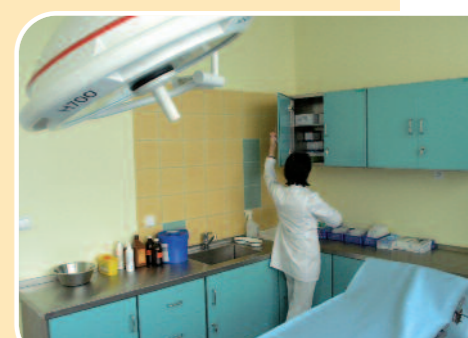
W gabinecie zabiegowym