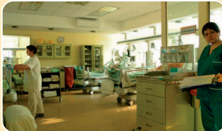
Czy będziemy mieli nowego pacjenta

W oddziale chirurgii ogólnej pracuje 6 lekarzy specjalistów chirurgii ogólnej, przy czym 3 z nich posiada też specjalizację w zakresie chirurgii onkologicznej. Dodatkowo opiekę nad chorymi sprawuje 7 lekarzy rezydentów, którzy są w trakcie specjalizacji. W oddziale chirurgii naczyniowej pracuje 5 specjalistów chirurgii naczyniowej oraz radiolog naczyniowy.