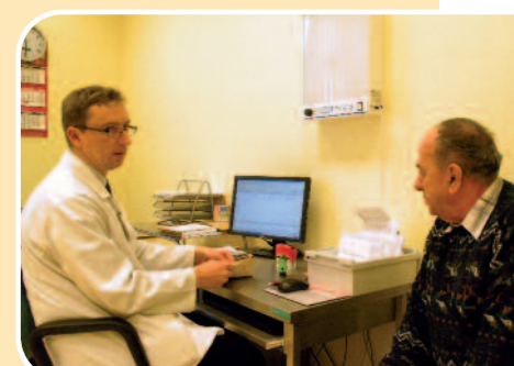
U lekarza specjalisty