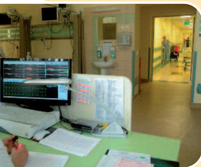
Monitoring w sali pooperacyjnej

medycznych, umówić się na wizytę u lekarza, skorzystać z porady specjalisty, a także złożyć wniosek o udostępnienie dokumentacji medycznej.