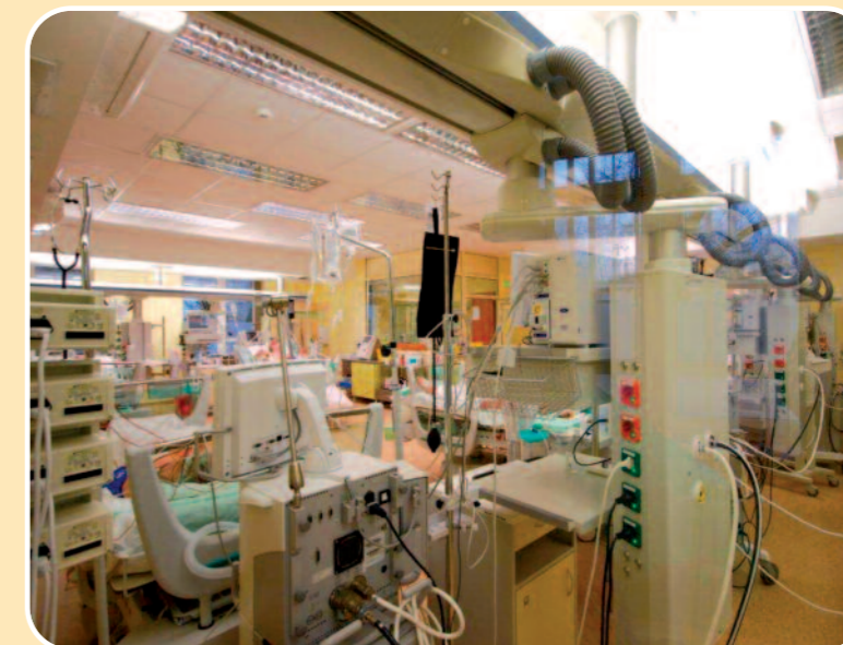
To już XXI wiek