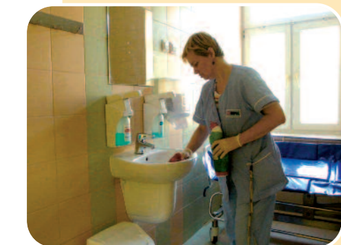
Łazienka do mycia chorych leżących

Od przedświątecznego otwarcia do 20 lutego na chirurgii ogólnej hospitalizowano ponad 400 chorych, a na naczyniowej ponad 100. W każdym oddziale około 80% pacjentów było operowanych, a około 20% leczonych zachowawczo.