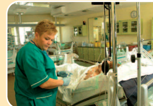
W wieloosobowej sali intensywnej terapii