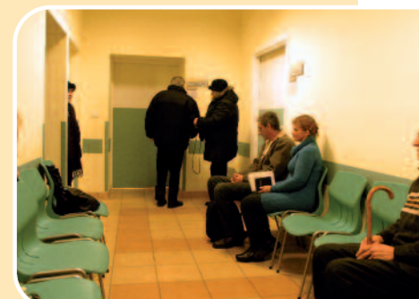
Przed gabinetem lekarskim