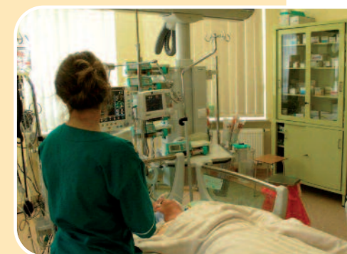
W jednoosobowej sali intensywnej terapii