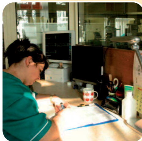
Punkt pielęgniarski w sali intensywnej terapii

Wysokie kwalifikacje kadry oddziału chirurgii ogólnej wraz z zapleczem diagnostycznym Szpitala Wolskiego pozwalają także sprostać stale rosnącemu zapotrzebowaniu na operacje z zakresu chirurgii onkologicznej. I u nas wykonuje się większość operacji z tego zakresu. Przeprowadza się radykalne operacje onkologiczne wycięcia żołądka, jelita grubego i piersi oraz większość operacji paliatywnych, czyli zabiegów poprawiających jakość życia chorych onkologicznych. Do najczęstszych należą operacje onkologiczne jelita grubego i odbytnicy, wykonywane w trybie planowym oraz nagłym.