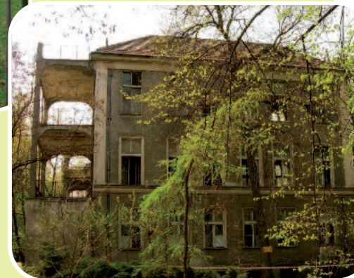
Dawny pawilon 9

Zakres opracowania obejmował powierzchnię funkcjonalno-użytkową, niezbędną do uzyskania prawidłowej organizacji oddziału szpitalnego oraz pracowni, a także zagospodarowanie terenu. Wszystkie prace musiały spełnić przyjęte przez szpital założenia dotyczące przeznaczenia i struktury pomieszczeń. I tak, liczba łóżek w oddziale została określona na minimum 55, przy czym w żadnej sali chorych nie może być więcej niż 3 łóżka, a każda z nich musi mieć łazienkę z WC. W oddziale, oprócz sal chorych, ma się znaleźć gabinet badań USG oraz pomieszczenia towarzyszące, tj. hol, szatnia, rejestracja, sala konferencyjno-dydaktyczna i zaplecze techniczne. Nieodłączną częścią każdej z prac było też opracowanie koncepcji pracowni diagnostyczno-endoskopowej, dostosowanej do potrzeb pacjentów hospitalizowanych, która musi być w stałej gotowości do wykonywania badań ze wskazań nagłych, realizacji kontraktu z NFZ na badania przewodu pokarmowego, jak również umów w tym zakresie, zawartych przez szpital z innymi instytucjami.