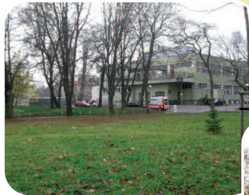
Miejsce na nowy pawilon

Zainteresowanie konkursem na opracowanie koncepcji architektoniczno-budowlanej budowy pawilonu przeznaczonego na potrzeby oddziału internistycznego oraz pracowni diagnostyczno-endoskopowej, który ogłosiliśmy w sierpniu, było nadspodziewanie duże. Po regulamin konkursu i pozostałe dokumenty zgłosiło się ponad 60 pracowni architektonicznych z kraju i zagranicy. Co ciekawe, informacja o tym konkursie, która zgodnie z przepisami została podana do wiadomości publicznej w Dzienniku Urzędowym Oficjalnych Publikacji Europejskich oraz na stronie internetowej naszego szpitala, pojawiła się też, wprawdzie w formie skróconej, ale z odesłaniem do źródła, na kilku portalach związanych z architekturą i budownictwem.