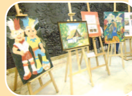
Prace podopiecznych Ośrodka Pomocy Społecznej Dzielnicy Wola