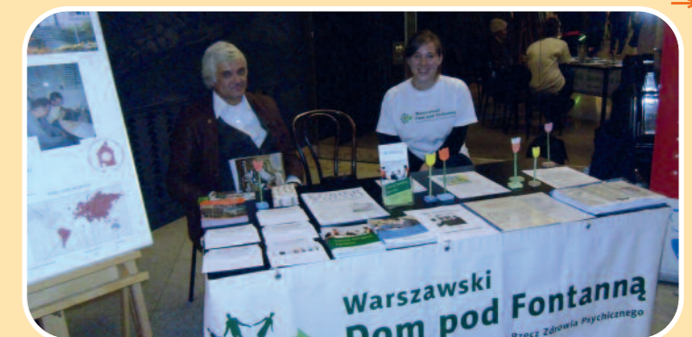
Stoisko Warszawskiego Domu pod Fontanną

Tej kwestii poświęciła sporo miejsca prof. Irena Lipowicz, Rzecznik Praw Obywatelskich (RPO), w oświadczeniu wydanym z okazji tegorocznych obchodów Światowego Dnia Zdrowia Psychicznego. Znalazło się w nim m. in. stwierdzenie, że obecna sytuacja wymaga podjęcia właściwych działań ze strony organów państwa, poczynając od prewencji, aż po staranne leczenie, opiekę