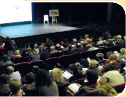
Czekamy na otwarcie

W ramach obchodów, w Teatrze na Woli odbyło się pierwsze Warszawskie Forum Psychiatrii Środowiskowej pod patronatem naukowym Mazowieckiej Filii Sekcji Psychiatrii Środowiskowej i Rehabilitacji Polskiego Towarzystwa Psychiatrycznego. Wydarzeniu patronowały ponadto: miesięcznik Okręgowej Izby Lekarskiej w Warszawie „Puls”, gazeta „Służba Zdrowia” (na jej stoisku rozdawano bezpłatnie wcześniejsze numery gazety, co cieszyło się dużym zainteresowaniem uczestników) oraz Teatr na Woli, który wspomagał nas w sprawach organizacyjnych.