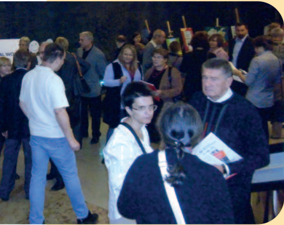
W przerwie obrad

i rehabilitację. Jest tam również informacja o dwóch ważnych wystąpieniach RPO: do ministra zdrowia w sprawie licznych nieprawidłowości i zaniedbań w realizacji NPOZP, oraz do prezesa NFZ o informację o zasadach i poziomie finansowania psychiatrycznej opieki zdrowotnej w Polsce.