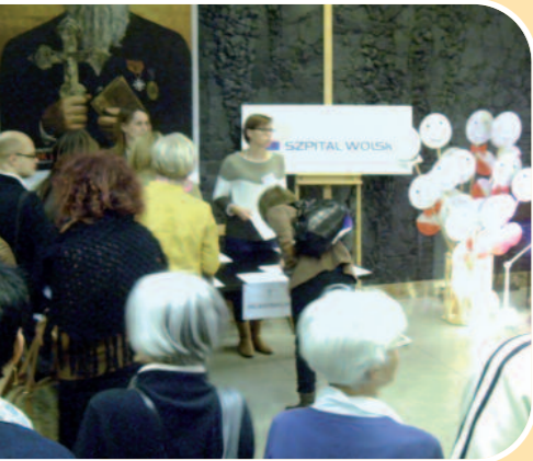
W kolejce do rejestracji

W nawiązaniu do pomysłu Światowej Federacji Zdrowia Psychicznego, Szpital Wolski na obchody Światowego Dnia Zdrowia Psychicznego zaproponował hasło: „Depresja: kryzys globalny a inicjatywy środowiskowe”. Obchody przygotowaliśmy we współpracy z Dzielnicą Wola, która objęła je patronatem.